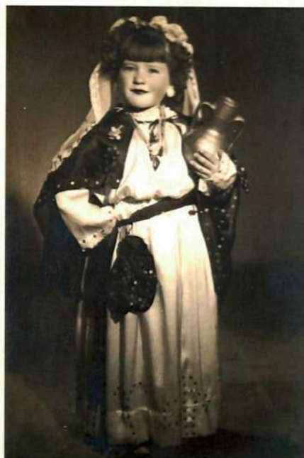
Niña Samaritana en Elche. Década de 1940.

La Cofradía de la Conversión de la Mujer Samaritana por Nuestro Señor de