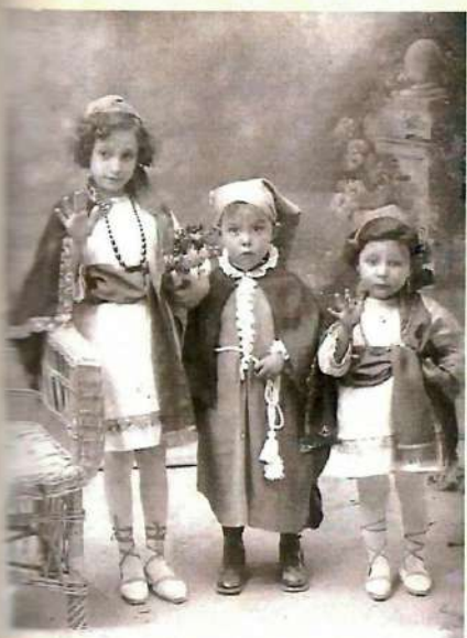
Samarietes de Crevillent.

papel de la Samaritana. Cabe destacar que, en esta localidad, esta tradición no es aislada, pues son muchos los personajes relacionados con la Semana Santa que se representan o se han representado de forma viviente a lo largo de la historia.