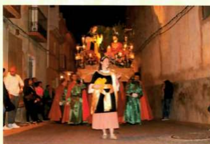
Samaritana viviente en Aspe. 2017.

En la propia Cofradía Califormia de Cartagena se da esta circunstancia, pues en 1993 se funda el Tercio Infantil Femenino de la Conversión de la Samaritana, pasando a estar su vestimenta inspirada en el traje que se le confeccionó a la imagen en el año 1985. Algo similar ocurre en otras poblaciones, como es el caso de Hellín, pero en ambos casos son filas de penitentes que visten de esta manera. Sin embargo, la tradición objeto de este artículo difiere de estas costumbres y es mucho más antigua. Sus características radican en que el cortejo procesional tiene la composición habitual, pero delante del paso procesional que representa el pasaje evangélico de Jesús y la Samaritana, aparece precediéndole una o varias niñas o jóvenes representando de forma viviente a esa mujer samaritana.